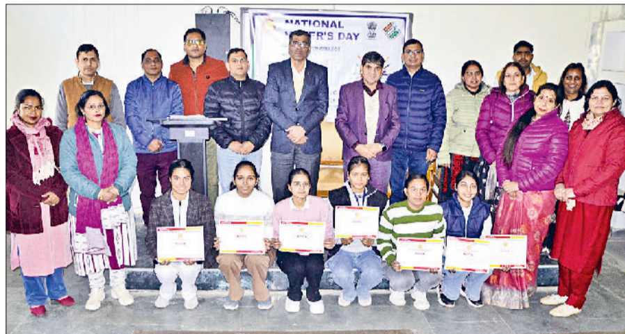
भिवानी। अतिथियों के साथ विजेता विद्यार्थी।

कार्यक्रम में विद्यार्थियों ने उत्साहपूर्वक भाग लेते हुए मतदान के महत्व, मतदाता सूची में नामांकन तथा लोकतंत्र की भजबूती पर अपने विचार प्रस्तुत किए।