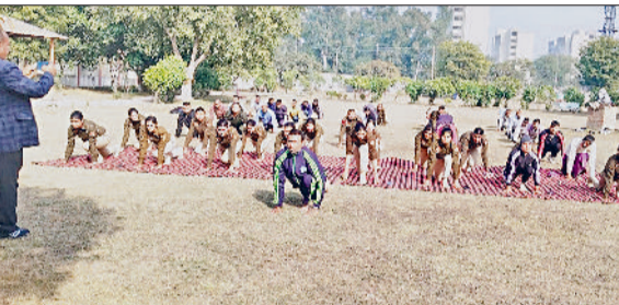
भिवानी। पुलिस लाइन में योग करते पुलिस अधिकारी व कर्मचारी।

पुलिस लाइन में योग शिविर में बताया योग के फायदे