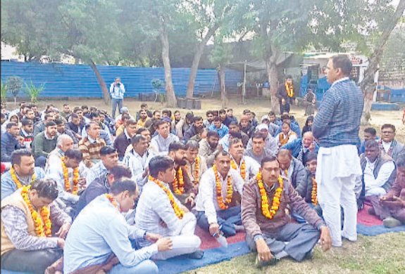
भिवानी। बोर्ड परिसर में भूख हड़ताल पर बैठे कर्मचारी।

संख्या में बोर्ड कर्मचारियों और विभिन्न श्रमिक संगठनों के नेताओं ने हिस्सा लिया।