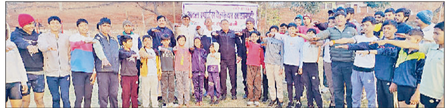
भिवानी। नशे के खिलाफ जागरूकता फैलाने की शपथ लते अटल स्पोर्ट्स वेलफेयर सोसाइटी के सदस्य।

अटल स्पोर्ट्स वेलफेयर सोसाइटी घर-घर जाकर फैलाएगी नशे के खिलाफ जागरूकता