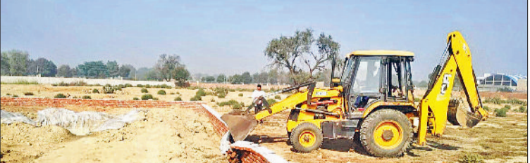
हरिभूमि न्यूज >>> भिवानी